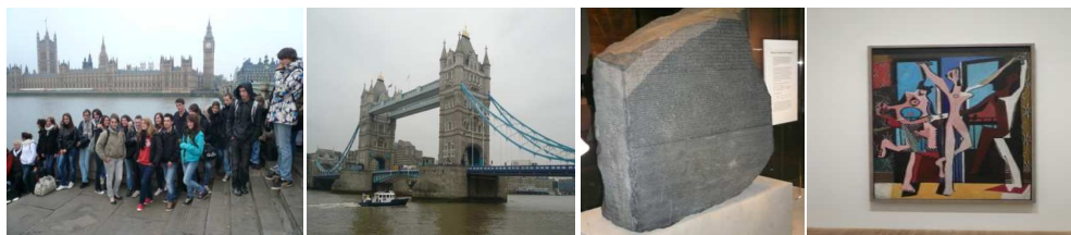
Près de la Tamise